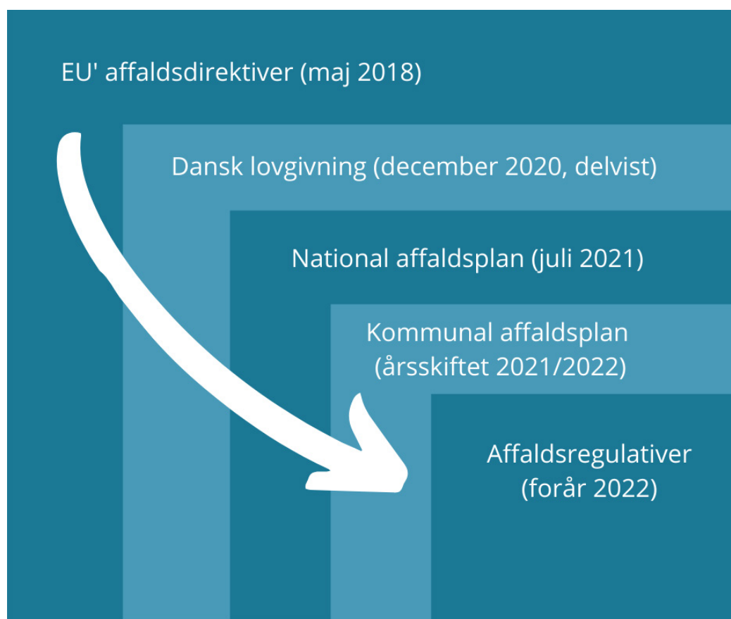
Figur 1: Figuren viser den 'kinesiske æske', som affaldsplanen indgår i, og tidspunkterne for de forskellige deles vedtagelse.